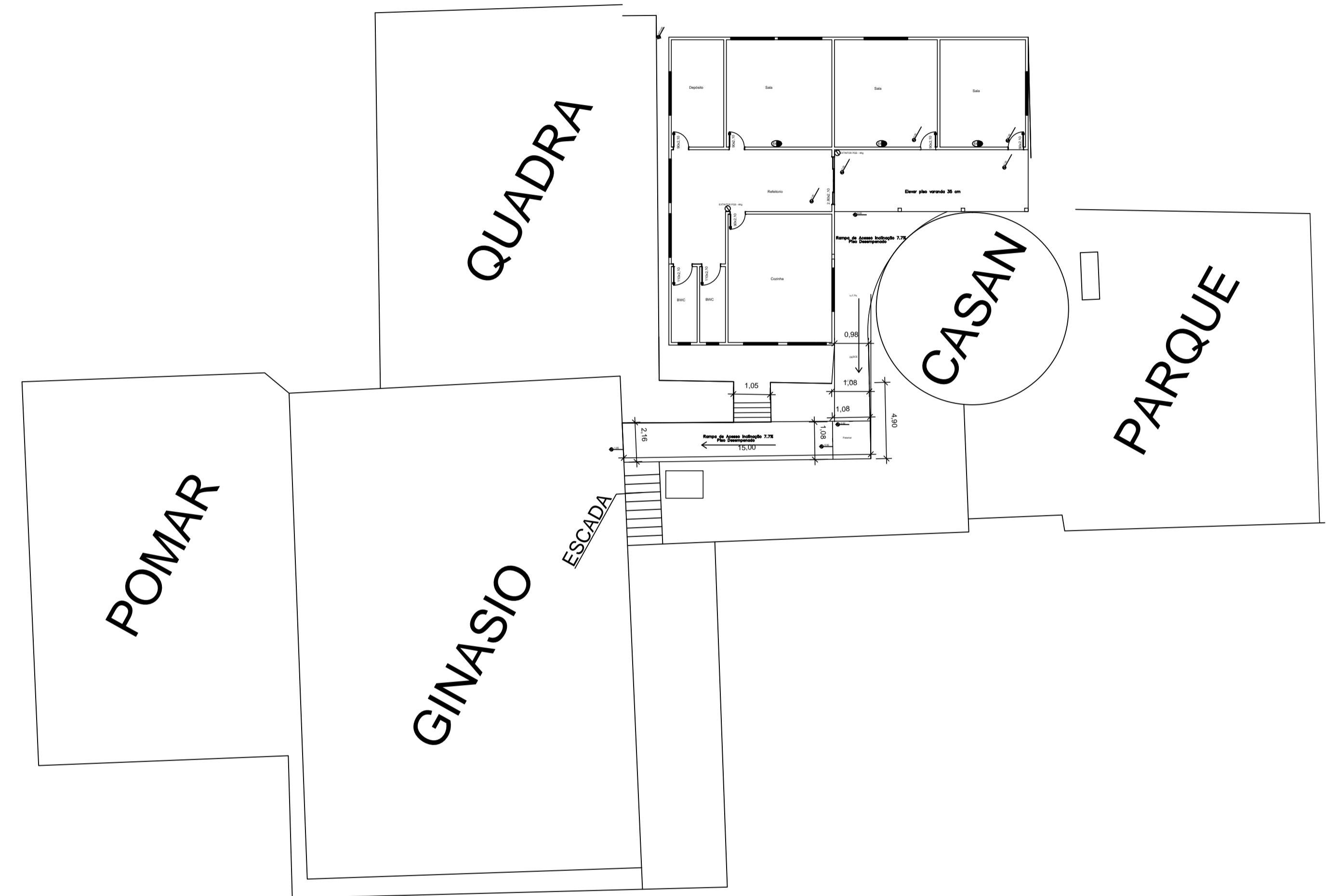
LOCAÇÃO esc: 1/250