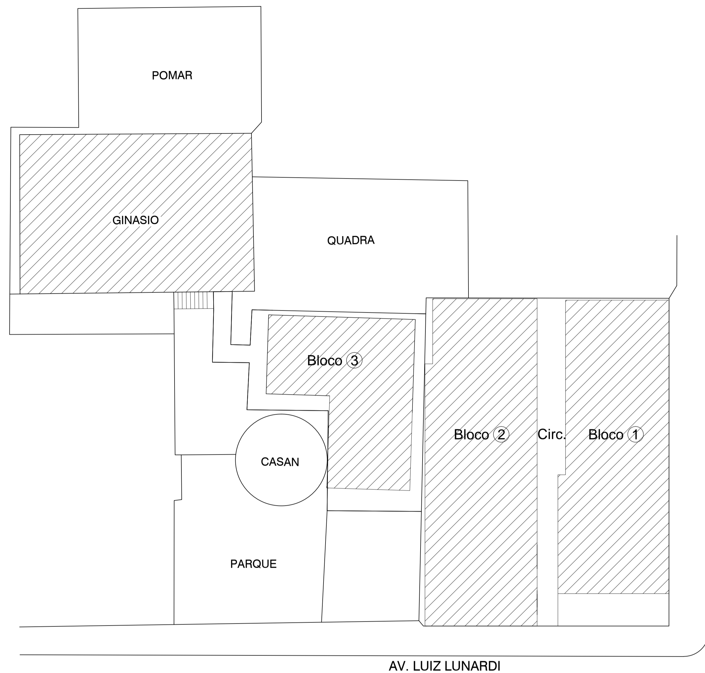
PLANTA DE LOCAÇÃO Esc. 1/500